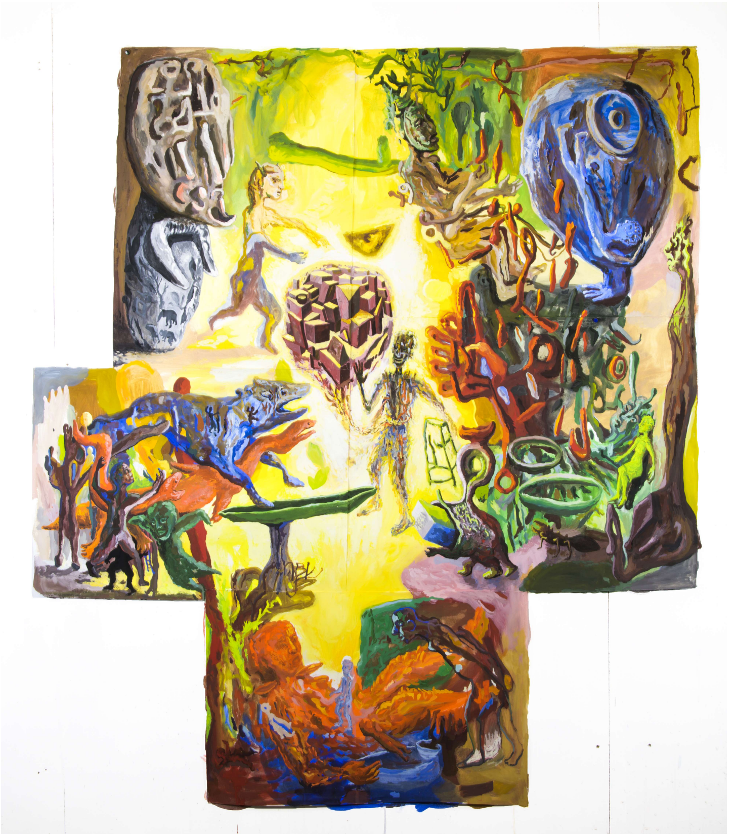
Assemblage 23 (Grand format mural environ 2m x 1,70) © Bruno Sentier