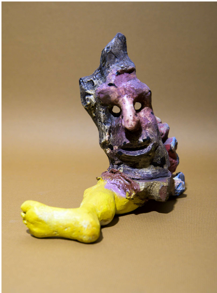
Le Sportif - Petite sculpture (environ 30 cm) © Bruno Sentier