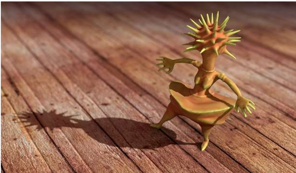
la Danseuse - Figurine 3D miniature issue d'image de synthèse (12 cm) © Bruno Sentier